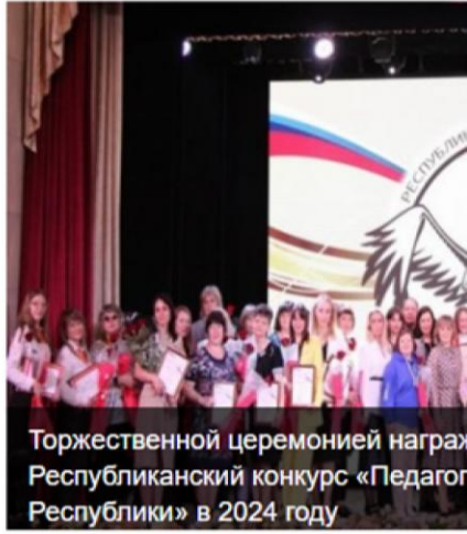
Торжественной церемонией награждены победители и лауреаты Республиканского конкурса «Педагог Республики» в 2024 году